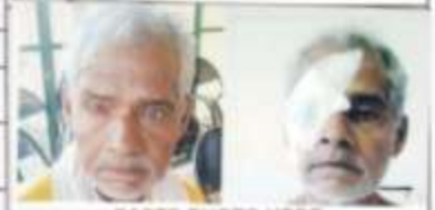
PASTE PHOTO HERE

FATHER'S/SPOUSE'S NAME: Chhitariya पिता/कटुम्भ का नाम